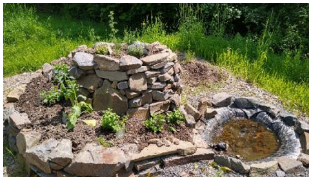
Kräuterspirale, die im Kurs „Eine Kräuterspirale im eigenen Garten selber bauen“ gemeinsam mit den Teilnehmenden entstanden ist. Durch ihre Bauart dient sie (ähnlich wie eine Trockenmauer) vielen Wildbienenarten als Nisthabitat.

Von der anfänglichen Garten- und Kursplanung über die Durchführung bzw. Maßnahmenumsetzung bis hin zur Erstellung der kursbegleitenden Broschüre wurde das Projektteam durch die Biologische Station Oberberg und die Bergische Agentur für Kulturlandschaft gGmbH sowie durch den Naturgarten e.V. (Regionalgruppe Oberberg) und den NABU Oberberg e.V. unterstützt.