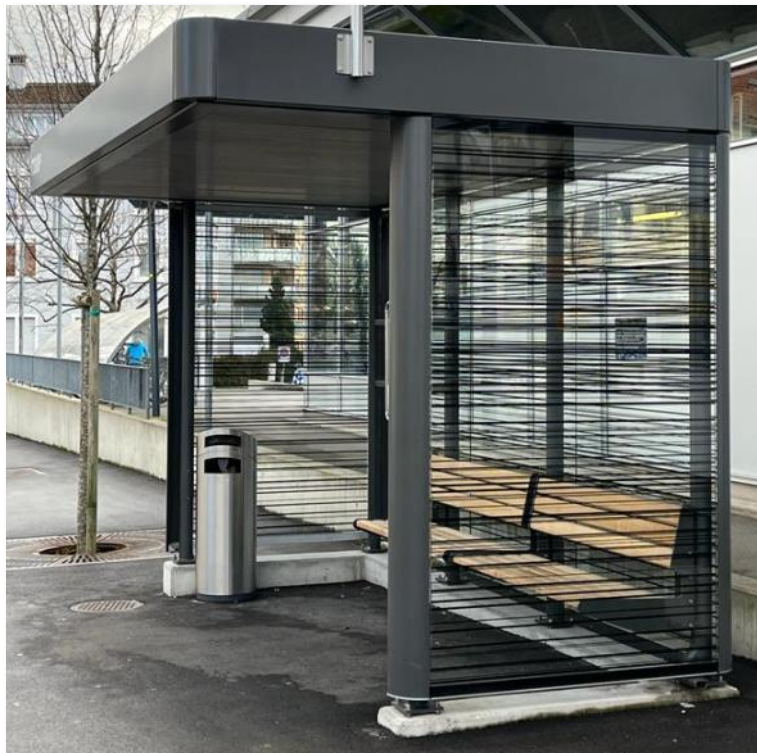
Buswartehäuschen (inkl. Dachbegrünung) in der Schweiz mit Streifenmuster, um vor Vogelkollisionen zu schützen.

Vogelschlag an Glas stellt für Vögel einen wesentlichen Mortalitätsfaktor dar. Allein in Deutschland wird von rund 100 Millionen Opfern pro Jahr ausgegangen. Glas wird von Vögeln nicht als Barriere wahrgenommen und sie erkennen nicht, dass gespiegelte Gehölze nicht real sind. Greifvogelsilhouettenaufkleber oder Produkte, die auf UV-Markierungen basieren, haben sich als unwirksam herausgestellt. Wirksam sind hingegen Muster, die auf die