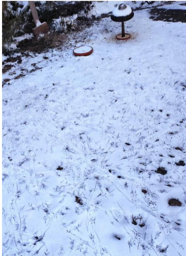
Die vielen kleinen Trittspuren zeigen: Im Winter freuen sich zahlreiche Vögel über Futterstellen und Trinkmöglichkeiten.