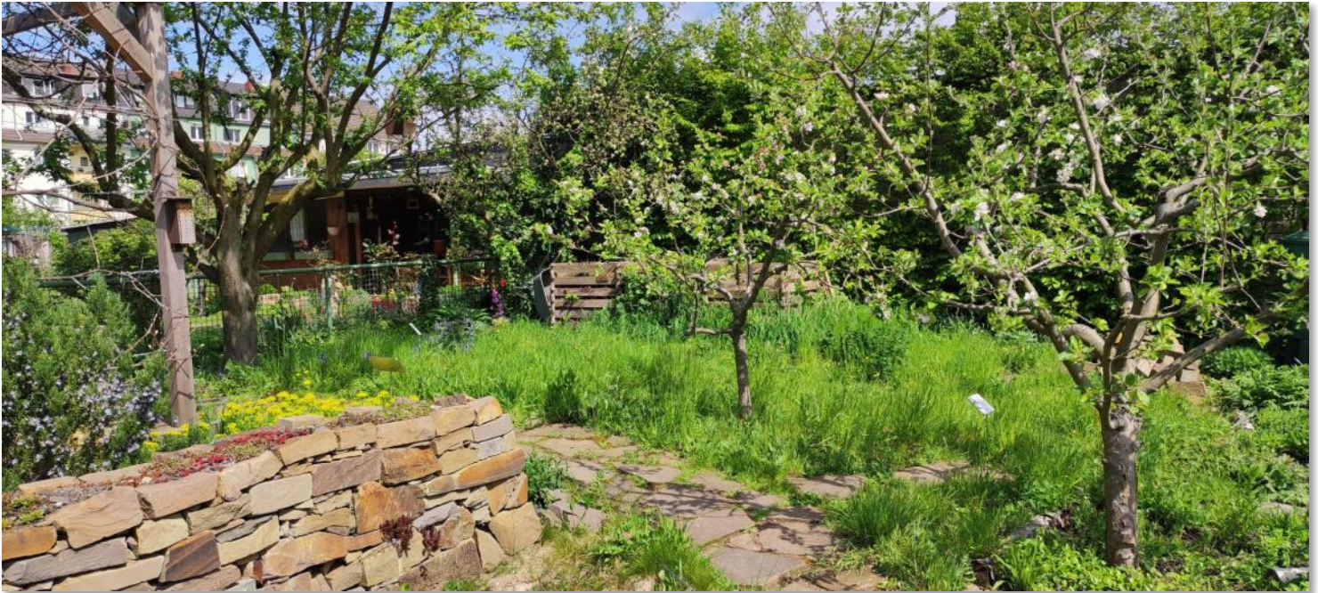
Dieser Naturgarten in Köln wurde im Projekt „Tausende Gärten - Tausende Arten“ mit Gold prämiert.