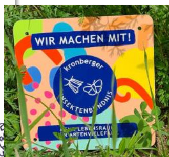
Flyer und Blühschild vom Insektenbündnis Kronberg.

Mehr Informationen rund um das Bündnis finden Sie unter www.kommbio.de